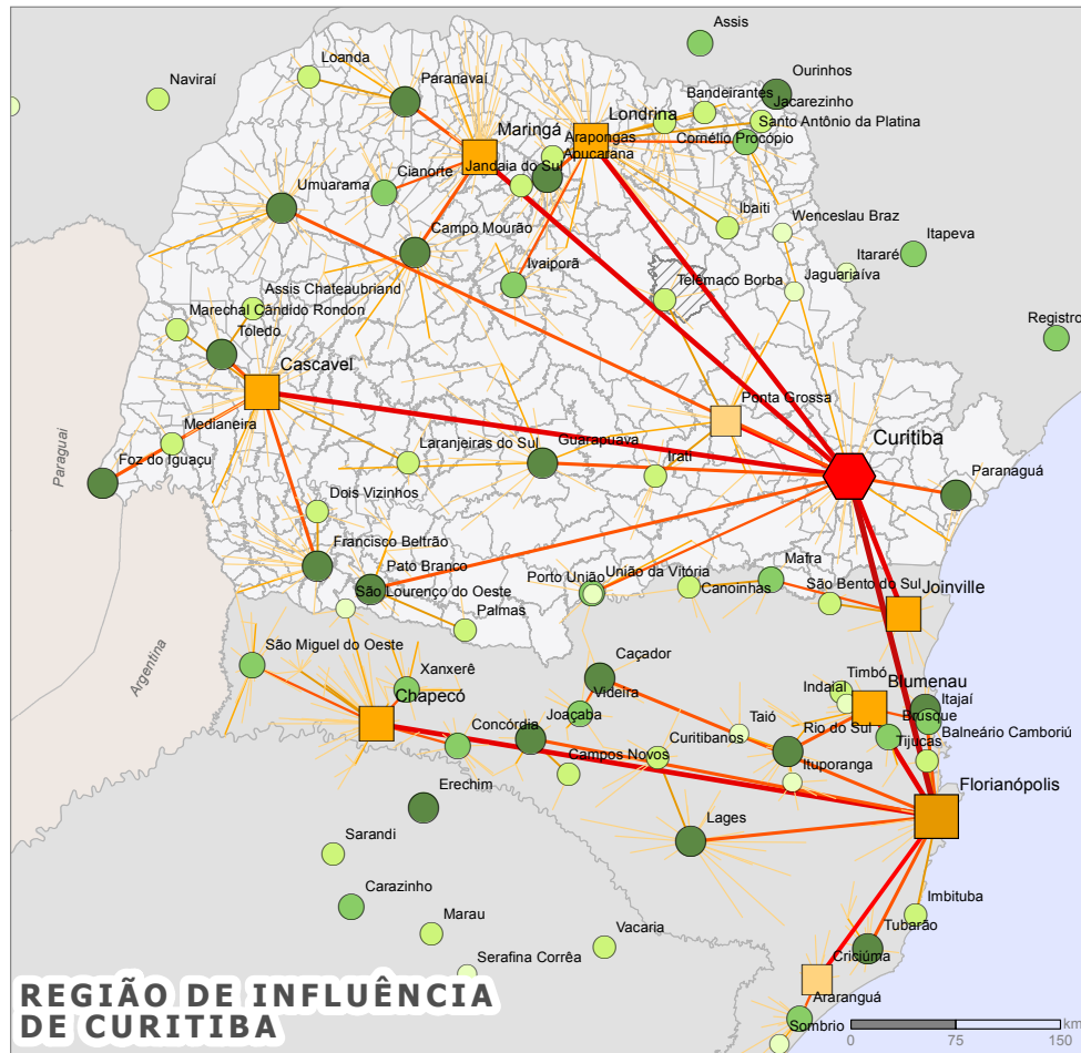
REGIÃO DE INFLUÊNCIA DE CURITIBA