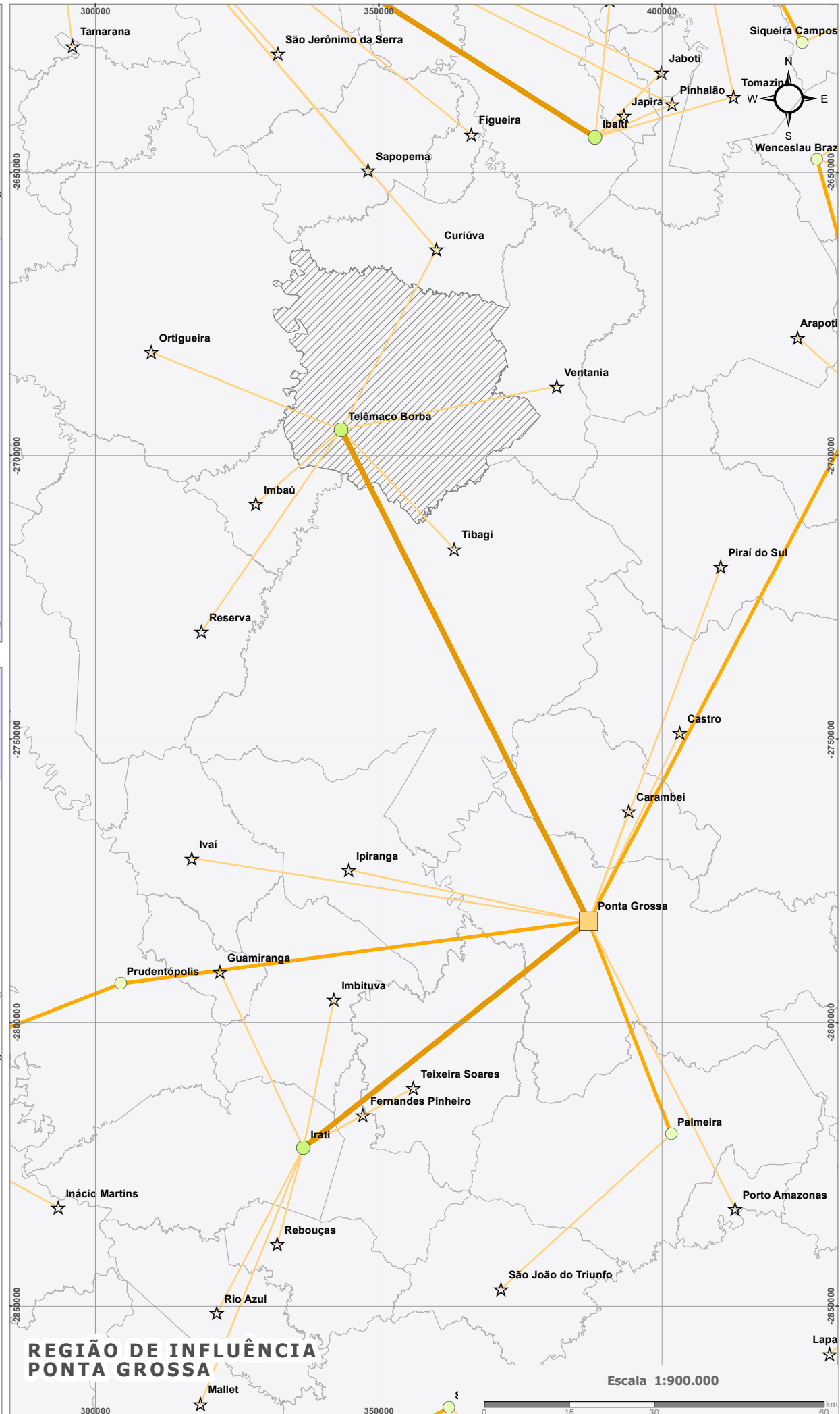
REGIÃO DE INFLUÊNCIA PONTA GROSSA